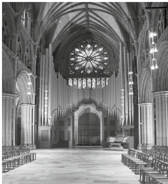
Trondheim (NO), Nidarosdom: zum Leben erweckte «Riesenorgel»

Die Geringschätzung dieses Orgeltyps führte in der 80-jährigen Geschichte der Orgel zu Umbauten und Substanzverlust. Dennoch gelangten wir bereits 1990 zur Überzeugung, dass man die Orgel restaurieren sollte, was aber nur mit einer ganzheitlichen Wiedergewinnung des Bauzustandes von 1930 sinnvoll erschien.