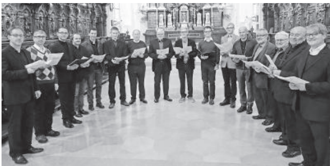
Stifts-Chor St. Leodegar