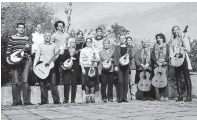
Zupforchester Luzern ZOL