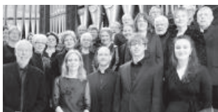
Chor Audite Luzern

17.15 Uhr Vorabendgottesdienst: Herr, wir trau'n auf deine Güte: Werke von Felix Mendelssohn Bartholdy (1809–1847), Franz Schubert (1797–1828) und Anton Bruck-