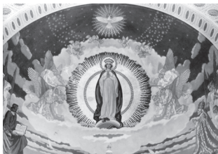
Marienmosaik St. Maria Neudorf St. Gallen