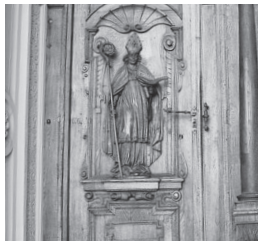
Hl. St. Leodegar/Hauptportal Hofkirche