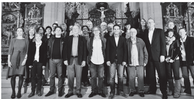
Stifts-Chor St. Leodegar