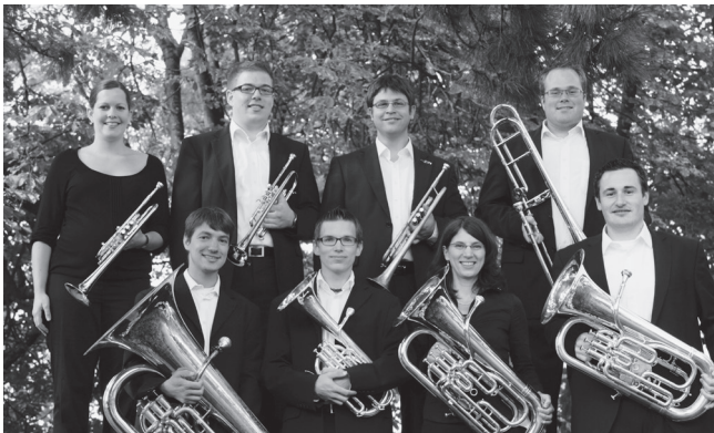
Lucerne Brass Ensemble LBE

ab 23.15 Uhr Turmmusik: Bläserformationen in der Gräberhalle, auf den Türmen und im Vorzeichen der Hofkirche; Hornformationen der Hochschule Luzern Musik und das Lucerne Brass Ensemble