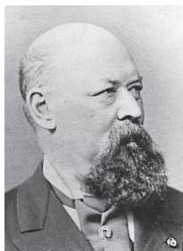
Franz von Suppé