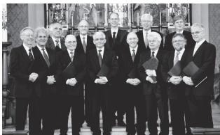
Schola Romana Lucernensis