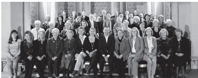
Kantorei St. Georg Küssnacht ZH