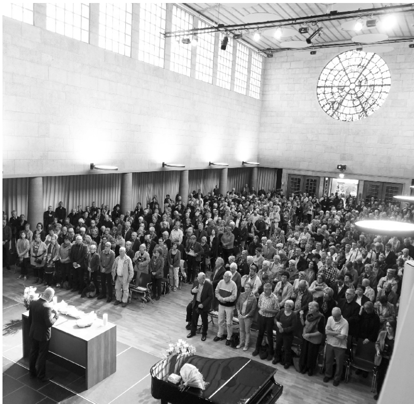
Gottesdienst bei der Uraufführung der Missa Mai im Kirchensaal MaiHof 2015