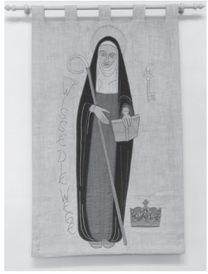
Hil. Hildegard von Bingen