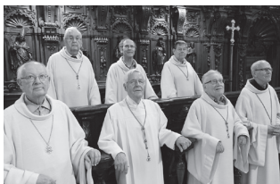
Chorherren des Kollegiatstiftes St. Leodegar